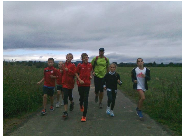
Lockeres Einlaufen vor einer Trainingseinheit