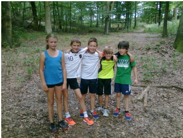
Bild vor dem Waldterrain